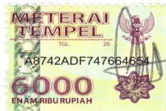
Cecilya Gunawan, SE.

Surabaya, 21 September 2016 Yang Menyatakan,