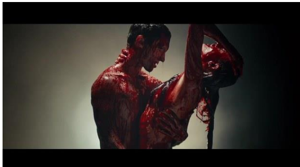
Gambar I.1 Tampilan dalam Video Klip “ Animals ”

Dari kutipan berita di atas yang dimaksud dengan ide gila dalam video klip “ Animals ” yaitu mengangkat sebuah tema sisi seksual perempuan dengan menambah sisi sensual dengan bermandikan sebuah darah untuk disiramkan pada tubuh perempuan dan juga Adam Levine. Seperti gambar 1.1