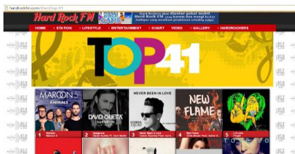
Gambar I.4 Top Chart Hardrock FM

Selain dalam lembaga survey luar negeri, dilihat dalam media konvensional radio yang khususnya kota Surabaya, lagu “ Animals ” masuk dalam chart top 40 dan meraih urutan no 1 di Hardrock FM, selain itu pada radio prambors menduduki peringkat 12, dapat dilihat pada gambar 1.4 dan 1.5.