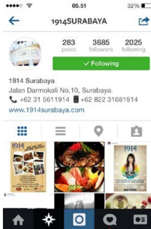
Gambar I.1.4. Instagram “Resto & Bar 1914 Surabaya” Sumber: Dokumentasi Penulis

Dari beberapa resto setara yang juga memanfaatkan media sosial Instagram untuk mempublikasikan restonya tersebut, penulis mengambil kesimpulan bahwa “ Resto & Bar 1914 Surabaya ” lebih unggul di bandingkan yang lain, karena “ Resto & Bar 1914 Surabaya ” mengadakan berbagai macam inovasi dengan menggunakan Instagram . Misalnya, melakukan regram 11 dan mengadakan event photo contest .