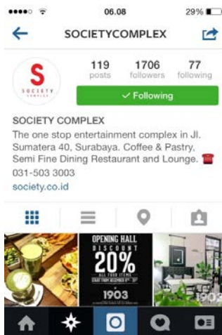
Gambar I.1.3. Instagram “Society Complex”

Strategi komunikasi pemasaran yang menggunakan internet, khususnya media sosial Instagram ini dilakukan oleh salah satu resto yang dapat dikatakan baru, meski demikian mampu menarik pengunjung dengan pesat, yakni “ Resto & Bar 1914 Surabaya ” (Tripadvisor, 2014:1) 6 . Fenomena ini menjadi menarik diteliti karena saat ini komunikasi pemasaran bergerak ke arah internet, khususnya media sosial Instagram , salah satunya di “ Resto & Bar 1914 Surabaya ”. Hal ini terlihat dari penggunaan media sosial Instagram