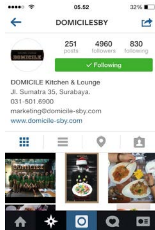
Gambar I.1.1. Instagram “ Domicile ”

Surabaya yang sama-sama memanfaatkan media sosial, yakni akun Instagram untuk berpromosi. Beberapa resto tersebut ialah “ Domicile ”, “ Le Café Gourmand ”, “ Society Complex ”, dan “ Resto & Bar 1914 Surabaya ”.