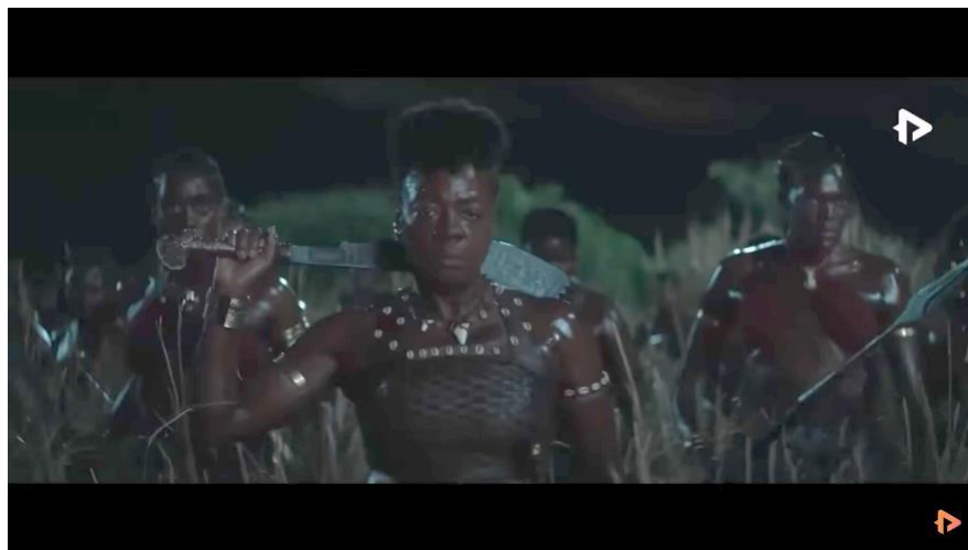
Gambar 1.3 Potongan scene film “The Woman King”

hal ini yang membuat laki-laki berperan untuk melindungi perempuan. Namun pada film The Woman King perempuan ditampilkan sebagai perempuan yang tangguh dan melakukan perlawanan terhadap laki-laki.