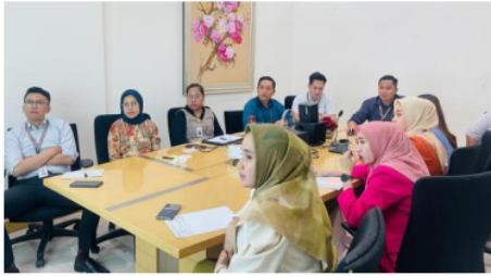
Gambar 4. Penggalan alternatif strategi pemasaran Marketing mix 7P