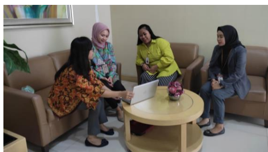
Gambar 5. Proses pemaparan penetapan strategi prioritas kepada Pimpinan PT Bank KB Bukopin Cabang Madiun

Proses hasil penetapan strategi prioritas disampaikan bersama dengan pihak internal PT. Bank KB Bukopin Cabang Madiun.