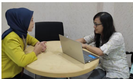
Gambar 3. Identifikasi pesaing