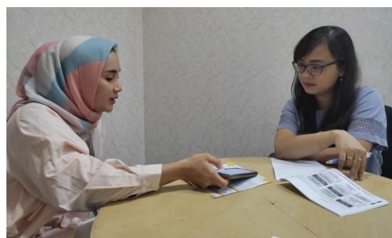
Gambar 2. Identifikasi masalah internal

Identifikasi masalah internal dilakukan dengan cara melakukan wawancara terhadap pihak internal PT Bank KB Bukopin Cabang Madiun guna mengetahui permasalahan yang saat ini sedang dihadapi oleh PT Bank KB Bukopin Cabang Madiun. Pada tahap ini diperoleh data-data dari PT Bank KB Bukopin Cabang Madiun, seperti segmen bisnis, laporan keuangan perusahaan, jumlah nasabah, produk yang ditawarkan, harga produk, daerah pemasaran, strategi pemasaran yang pernah dimiliki oleh PT Bank KB Bukopin Cabang Madiun, strategi yang sedang dimiliki oleh PT Bank KB Bukopin Cabang Madiun serta sistem promosi yang saat ini sedang dilakukan. Dari hasil identifikasi masalah internal diperoleh informasi bahwa PT Bank KB Bukopin Cabang Madiun saat ini melakukan pemasaran produknya pada wilayah Karesidenan Madiun