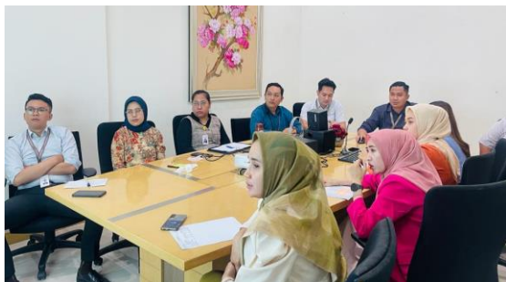
Gambar 4. Penggalan alternatif strategi pemasaran Marketing mix 7P