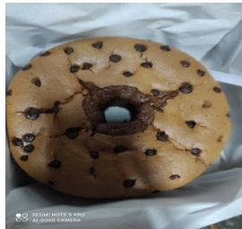
Gambar 1. Cracking pada Produk Chiffon Cake

(Gomez and Sciarini, 2015). Distribusi air yang relatif homogen pada adonan produk pangan seperti produk cake , biskuit dan mi akan mencegah terjadinya keretakan ( cracking ) pada permukaan produk, seperti yang terlihat pada produk Chiffon cake pada Gambar 1 di bawah ini. Cracking pada crackers dapat meningkatkan rejected product karena akan dapat menjadikan produk hancur akibat guncangan selama transportasi. Hal ini sangat merugikan secara ekonomi.