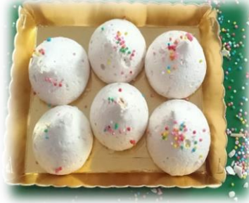
Gambar 2. Produk Schumpjes (Kue Busa)