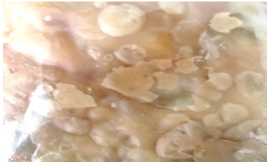
Gambar 3. Surface Bubble pada Kulit Martabak Telur

Pembentukan surface bubble dapat menjadikan produk menjadi renyah ( crunchy ) sehingga akan meningkatkan kesukaan konsumen. Gambar surface bubble dapat dilihat pada Gambar 3 di bawah ini.