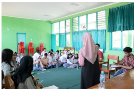
Gambar 4. Simulasi English Debate oleh mahasiswa

Pada akhir acara, pemateri menyampaikan beberapa mosi/ motion yang akan digunakan pada workshop English debate di pertemuan yang akan datang.