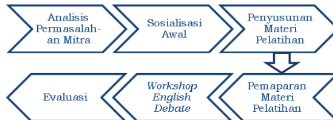
Gambar 1. Tahapan Kegiatan

Program kegiatan pengabdian kepada masyarakat ini dilaksanakan sesuai dengan tahapan-tahapan yang tergambar dalam gambar berikut ini: