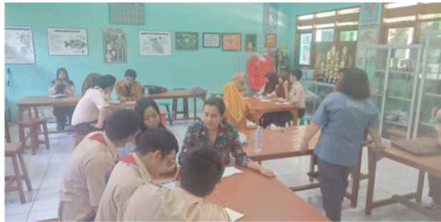
Gambar 5. Workshop Hari Pertama

menggunakan bahasa Inggris. Hal tersebut terjadi karena kurangnya pembiasaan untuk berbicara bahasa Inggris.