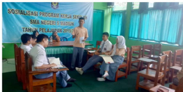
Gambar 6. Workshop Hari Kedua

Pada workshop hari kedua yang berlangsung pada tanggal 7 Oktober 2019, peserta sudah nampak lebih siap untuk berdebat. Secara umum, proses yang dilakukan sama, mulai dari persiapan debat hingga debat selesai. Yang berbeda, kali ini mahasiswa pembantu tim pelaksana tidak lagi mendampingi peserta workshop dalam mempersiapkan materi debat. Para peserta harus mempersiapkan materinya sendiri. Hasil yang didapatkan pada workshop hari kedua adalah peserta yang lebih antusias, lebih berani menyampaikan argument serta pendapat, dan tentunya lebih yakin dalam berbicara menggunakan bahasa Inggris. Peserta tidak lagi malu-malu dan sudah mulai lancar berbicara bahasa Inggris. Dari segi penguasaan skill debat pun mereka sudah lebih baik.