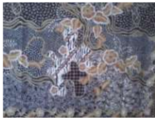
Gambar 3. Batik Tulis Pewarna Alam dan Kimia

Ada perbedaan tingkat ketajaman warna produk batik, di mana produk batik dengan warna kimia lebih kuat warnanya sedangkan produk batik dengan warna alam lebih lembut dan unik. Variasi warna alam juga lebih terbatas dibanding warna kimia.