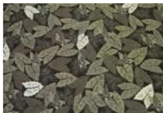
Gambar 5. Motif Kulon Progo Yogyakarta dengan Pewarna Alam