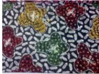
Gambar 6. Motif Madura dengan Pewarna Kimia

Penggunaan produk batik tulis saat ini juga mulai bervariasi, dapat digunakan sebagai dress , blouse , kemeja, syall , pashmina , taplak meja, dan lain-lain.