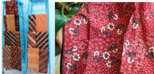
Gambar 1. Batik Tulis Pewarna Indigizol dan Napthol