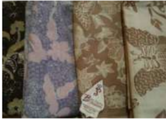
Gambar 2. Batik Tulis Pewarna Alam