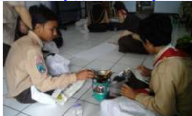
Gambar 10. Pelatihan membatik bagi siswa-siswi SMP di Kota Madiun