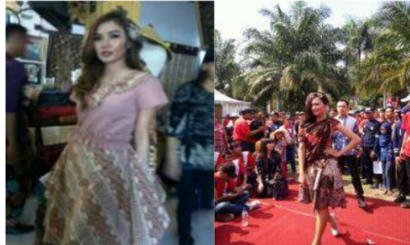
Gambar 9. Peragaan Busana Batik Tulis Mitra IbM Kerajinan Batik Tulis Herbal Kota Madiun