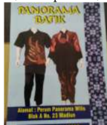
Gambar 8. Tas Batik Mitra IbM Kerajinan Batik Tulis Herbal Kota Madiun