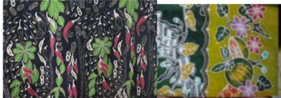
Gambar 4. Motif Pecel Madiun dan Motif Seger Arum Madiun dengan Pewarna Kimia (Remazol)