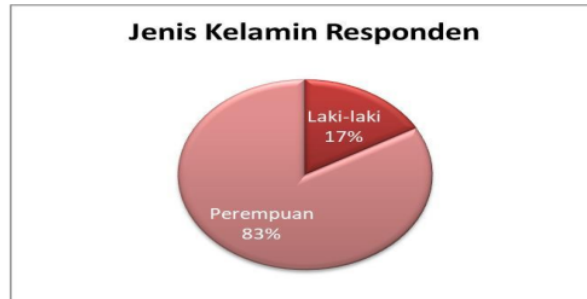
Gambar 1. Profil responden berdasar jenis kelamin