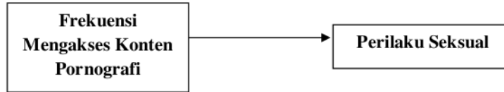
Gambar 1. Hubungan Variabel Penelitian

Remaja adalah masa di mana individu memasuki masa pubertas dan organ-organ serta hormon-hormon seksual mulai berkembang. Berkembangnya organ-organ dan hormon-hormon seksual pada masa ini membuat para remaja mulai mengalami ketertarikan dan menjalin hubungan dengan lawan jenis. Lebih dari itu, perilaku seksual yang muncul pada masa remaja akibat dari berkembangnya organ dan hormon seksual adalah mereka melakukan masturbasi atau onani, kissing, necking, petting, oral seks dan anal seks , hingga perilaku seks yang paling berisiko, yaitu intercourse .