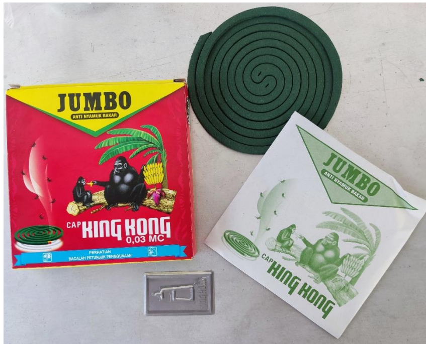
Gambar I.3. Obat Nyamuk Bakar Cap Kingkong Jumbo.