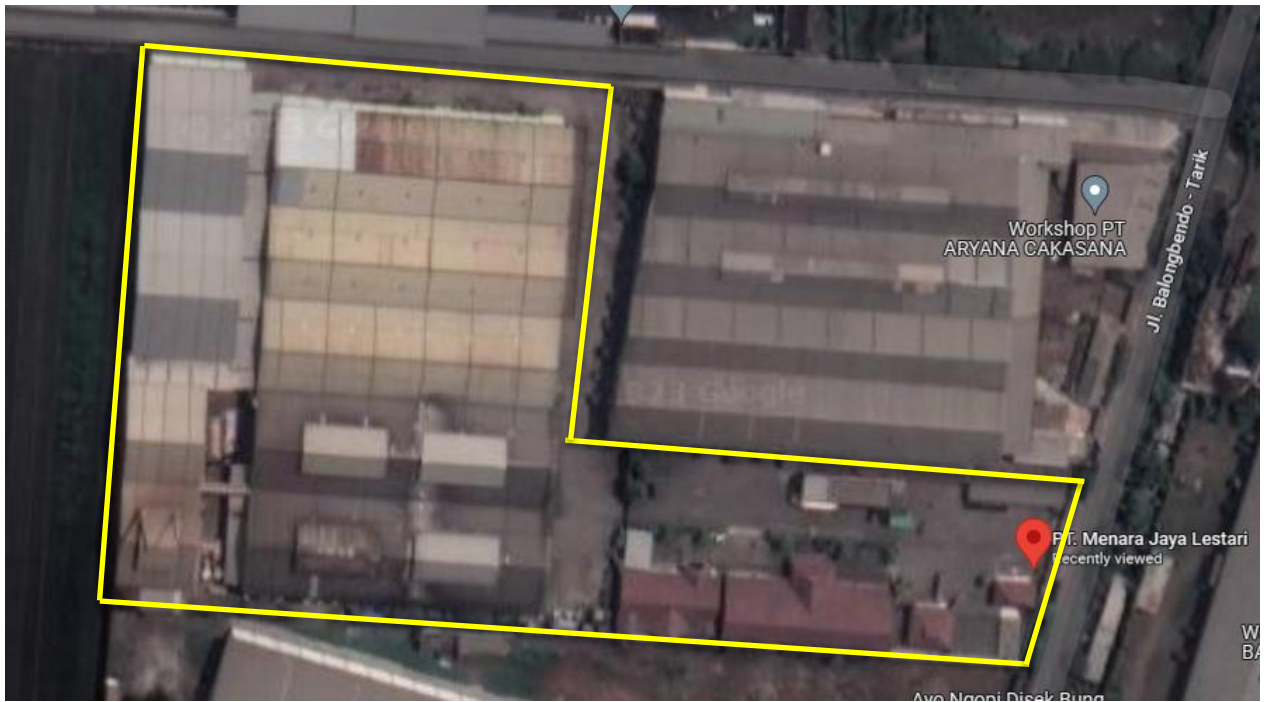
Gambar I.1. Lokasi PT. Menara Jaya Lestari Berdasarkan Google Earth

Tata letak pabrik ( plant layout ) merupakan komponen penting yang perlu diperhatikan agar proses operasi pabrik berjalan secara efisien dan efektif. Tata letak pabrik adalah penataan lokasi berbagai fasilitas yang berrada di area pabrik antara lain area produksi, area penyimpanan, utilitas, parkir, dan sebagainya. Plant layout dari PT. Menara Jaya Lestari dapat dilihat pada Gambar I.2.