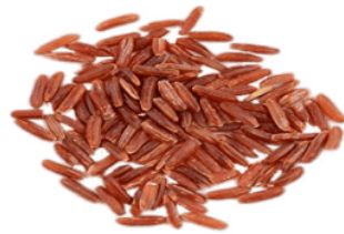
Gambar 4. Beras merah

yang lebih jelas, selain itu untuk ayam jago, pemberian pakan beras merah dapat membantu terbentuknya massa otot dari ayam. Meskipun dalam jumlah terbatas, beras merah juga dikonsumsi oleh masyarakat dengan diolah secara konvensional. Beras merah pada skala industri dimanfaatkan sebagai bahan makanan bayi pendamping air susu ibu. Beras merah dapat dilihat pada Gambar 4.