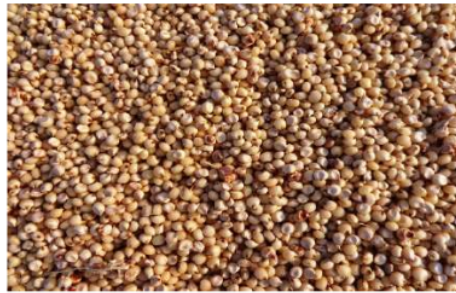
Gambar 5. Sorgum ( Sorghum bicolor )

Sorgum adalah serealia ke lima terbanyak diproduksi di seluruh dunia dan menjadi makanan pokok di beberapa negara Afrika. Meskipun ada di Indonesia, sorgum tidak terlalu populer. Beberapa jenis bubur tradisional di Indonesia diolah menggunakan sorgum sebagai bahan bakunya. Sementara itu di Afrika, sorgum diolah secara tradisional dengan dikukus, direbus, atau ditepungkan sebagai bahan pembuatan roti. Berdasarkan sejarahnya, sorgum diduga berasal dari benua Afrika di daerah Abyssinia (Ethiopia). Sorgum dapat dilihat pada Gambar 5.