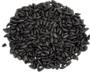
Gambar 2. Beras hitam

dijumpai di Jawa dan digunakan sebagai salah satu bahan untuk sesajen , yaitu kepercayaan masyarakat dalam bentuk memberikan persembahan kepada penguasa alam semesta yang memiliki kemampuan mengatur segala sesuatu, termasuk kehidupan manusia. Sesajen dilakukan masyarakat dalam setiap peristiwa besar yang terjadi dalam hidup seperti kelahiran, pernikahan, dan kematian, dimana tujuannya adalah memperoleh keselamatan dari yang maha kuasa. Beras hitam dapat dilihat pada Gambar 2.