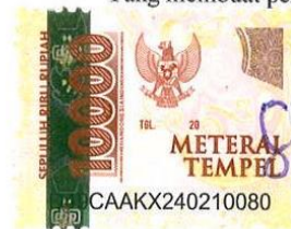
Sesilia Iva Prasetya