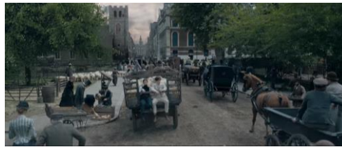
latar setting film London tahun 1800an