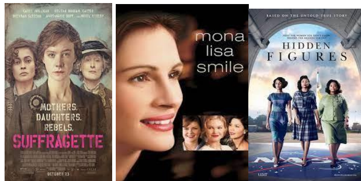
Film Suffragette(kiri), Film Monalisa Smile(tengah), film Hidden Figures(kanan)