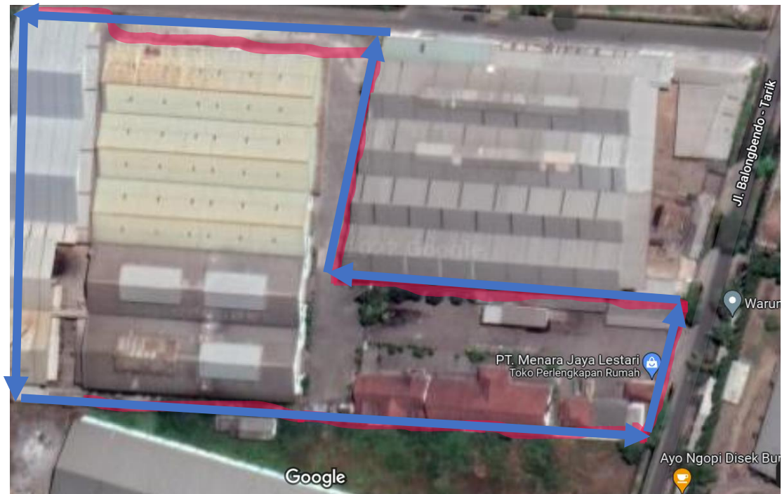
Gambar I. 1 Penampakan PT. Menara Jaya Lestari berdasarkan google maps

PT. Menara Jaya Lestari terletak di Jl. Balongbendo – Tarik No.51, Balongbendo Kabupaten Sidoarjo, Jawa Timur, 61263 (Gambar I.1). PT. Menara Jaya Lestari memilih berlokasi di Kecamatan Balongbendo, Kabupaten Sidoarjo dengan mempertimbangkan beberapa alasan, seperti kemudahan mendapatkan tenaga kerja, kemudahan distribusi produk, dan masalah pencemaran.