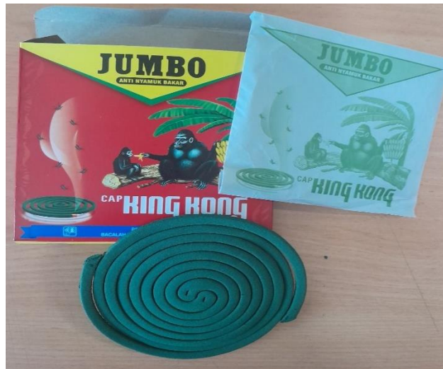
Gambar I. 3 Obat Nyamuk Bakar KING KONG