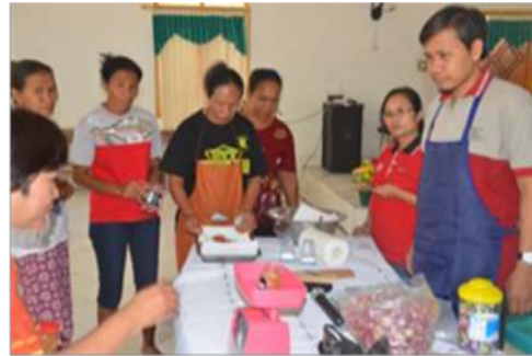
Gambar 3. Pengemasan Barang Goreng

Gambar 2 dan 3 menunjukkan kegiatan pelatihan pembuatan dan pengemasan bawang goreng. Partisipan bersemangat dalam mengikuti kegiatan pelatihan ini. Partisipan mengalami kesulitan pada saat menggunakan timbangan untuk bawang mentah dan untuk pengemasan bawang goreng. Oleh karena itu, latihan untuk menggunakan peralatan dibutuhkan oleh masyarakat sehingga mereka terbiasa dalam menggunakannya. Sedangkan kegiatan menggoreng merupakan hal mudah bagi partisipan karena mereka sudah terbiasa melakukannya.