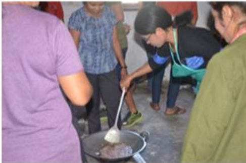
Gambar 2. Pembuatan Bawang Goreng

Pelatihan pembuatan bawang goreng dilakukan dalam dua tahapan, yaitu pertama, tutorial mengenai (i) peralatan-peralatan yang digunakan untuk menimbang, mengiris, dan menggoreng bawang merah, serta (ii) resep atau formula yang akan digunakan untuk membuat bawang goreng. Kedua adalah praktek membuat dan mengemas bawang goreng.