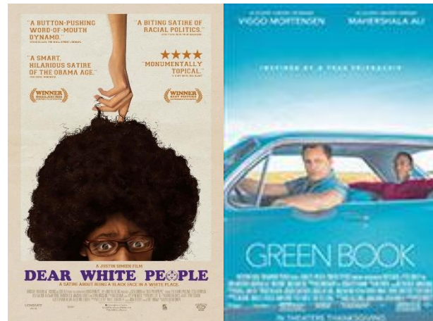
Gambar I.3. Poster film Dear White People dan Green Book

Sumber : Code Red Films (Dear White People) dan DreamWorks Pictures (Green Book)