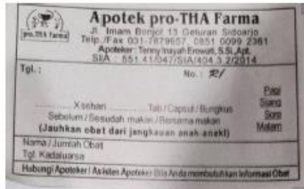
Etiket putih untuk obat dengan bentuk sediaan padat