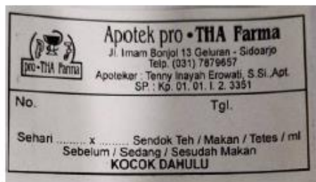
Etiket putih untuk obat dengan bentuk sediaan cair