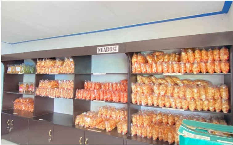
Foto gudang stock keripik madani