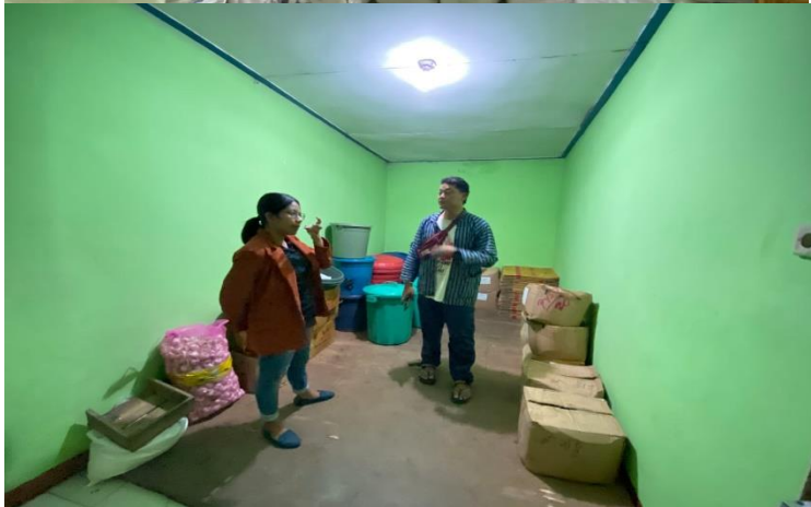
Foto tempat penjualan keripik madani