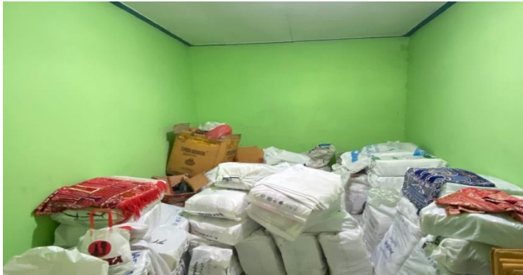
Foto gudang bahan baku dan gudang kemasan