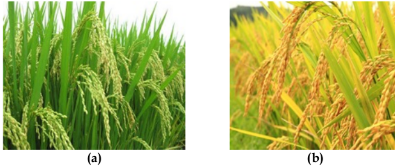
Gambar 2. (a) Helaian daun berwarna hijau tua menyerupai garis (pita) dengan bagian ujung meruncing dan (b) helaian daun berubah kuning keemasan menjelang tanaman padi memasuki masa panen

Tinggi tanaman padi berkisar 1 sampai 1,5 meter, pada tiap-tiap buku batang tumbuh daun yang berbentuk pita dan pelepah. Pelepah tersebut membalut hampir sekeliling batang. Di dalam tanah dari tiap-tiap buku tumbuh tunas yang dapat menjadi batang (anakan). Anakan padi itu dapat pula beranak, sehingga tumbuh 40-50 batang anakan (Soemartono dan Haryono, 1972). Akar padi digolongkan dalam akar serabut, akar yang pertama muncul pada saat berkecambah dari embrio disebut akar primer, sedangkan akar sekunder yang tumbuh dari buku terbawah dari batang disebut juga akar adventif (Manurung dan Ismunadji, 1988).