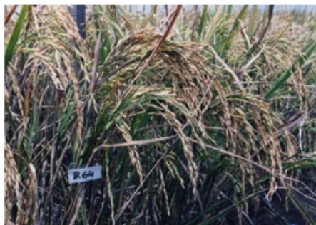
Gambar 3. Tanaman padi IR64

IR64 merupakan salah satu varietas unggul dari hasil silangan IRRI. Benih padi IR64 dilepas pada tahun 1986. Penggunaan benih padi IR64 di Indonesia masih tinggi mencapai 45% dengan produktivitas 4,1 sampai 5,6 ton per hektar. Keunggulan padi IR64 (Gambar 3) adalah berumur panen 115 hari, produksi mencapai 5 ton/ha, rasa nasi yang enak, tahan wereng cokelat tipe 1 dan tipe 2, dan tahan kerdil rumput (BPTP, 2008).