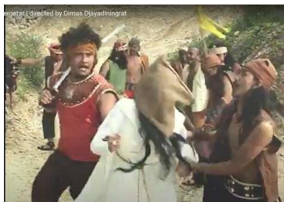
Gambar I.4 iklan Ovo “Satria Bergetar”

Di dalam iklan OVO yang berjudul Santria Bergetar, terlihat bahwa peran yang dilakukan oleh para lelaki adalah memiliki peran penjahat diperjelas dengan senjata yang dipengang oleh para lelaki tersebut, dan juga terlihat watak yang arogan di dalam video iklan tersebut. Sedangkan perempuan yang ada di dalam video ini sedang tidak berdaya karena ditangkap oleh para penjahat. Terbukti bahwa media massa sering menggunakan perempuan sebagai gambaran bahwa perempuan itu lemah dan tidak berdaya.