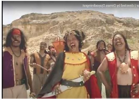
Gambar I.3 Iklan Ovo “Satria Bergetar”

kebanyakan perempuan membeli berbelanja untuk mempercantik diri agar mereka terlihat lebih menarik. Tetapi berbanding terbalik dengan iklan Free Fire .