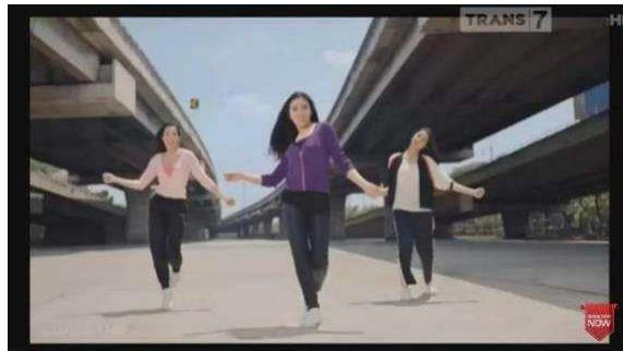
Gambar I.1 Iklan “Sunslik Black Shine Shampoo”