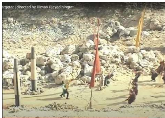
Gambar I.5 Ikan Ovo“Satria Bergetar”

Digambar di atas terlihat perempuan yang tidak berdaya karna ditangkap oleh para penjahat yang di pernak oleh pria. Berbeda dengan iklan Free Fire , di iklan Free Fire Moco dan Kelly sebagai pemeran perempuan yang melakukan aksi beladiri dan melakukan perkelahian yang melawan para polisi yang diperankan oleh laki laki. Berbanding terbalik dengan iklan OVO.