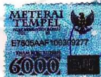
Gema Citra Pratiwi