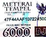
Gema Citra Pratiwi

Surabaya, 21 April 2010 Yang menyatakan,