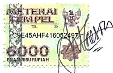
Febel Antaresia Triwinata