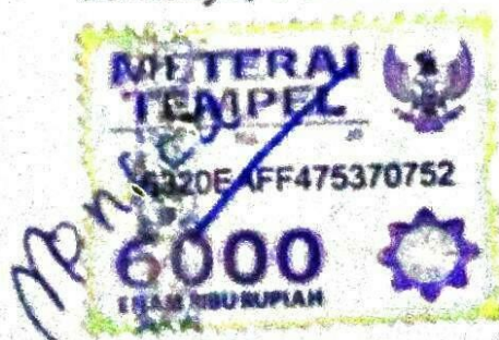
(Monica Septian Tanto)