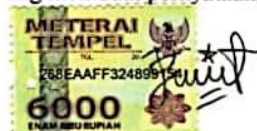
Puspita Dewi Harmoko