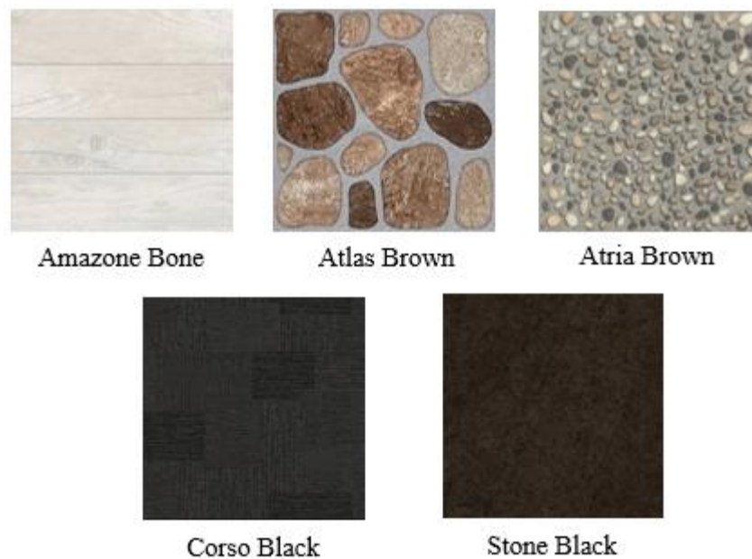
Gambar I. 2 Motif Keramik Produksi PT. Platinum Ceramics Industry

Berikut ini adalah beberapa contoh motif keramik berukuran 40x40 yang diproduksi oleh PT. Platinum Ceramics Industry di bawah merk Platinum.