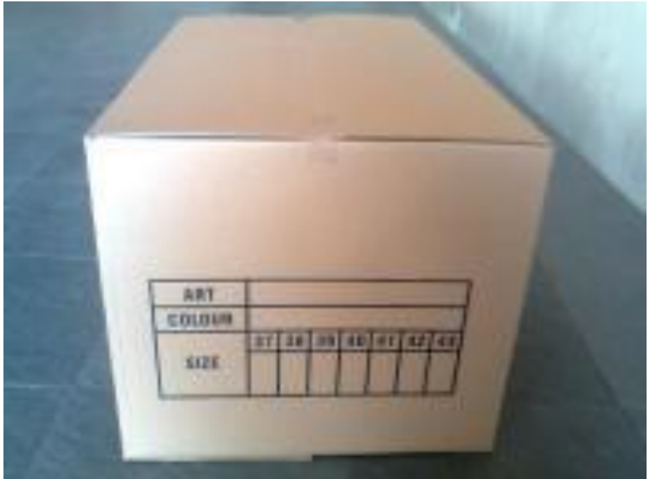
Kemasan Sekunder ( duplex non coated ) Produk Pembekuan Udang PT.SAT