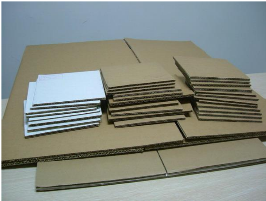
Kemasan Tersier ( corrugated paperboard ) Produk Pembekuan Udang PT.SAT