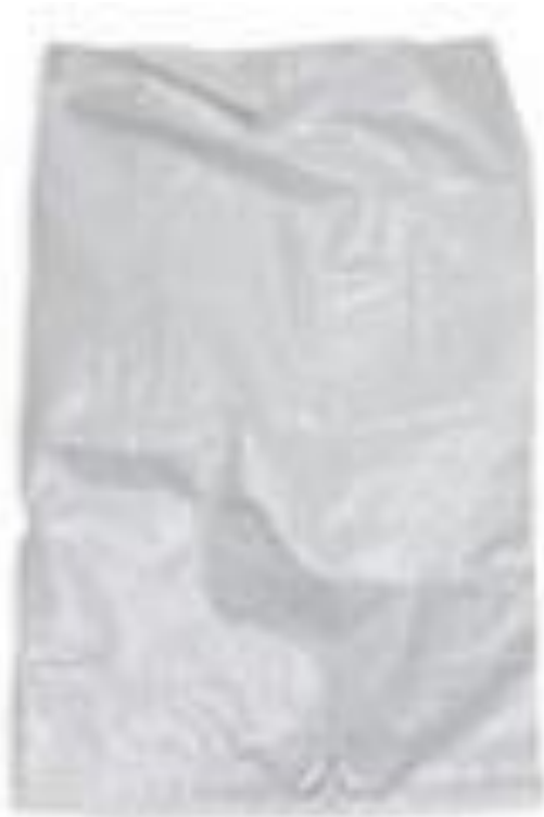
Kemasan Primer ( polyethilen bag ) Produk Pembekuan Udang PT.SAT