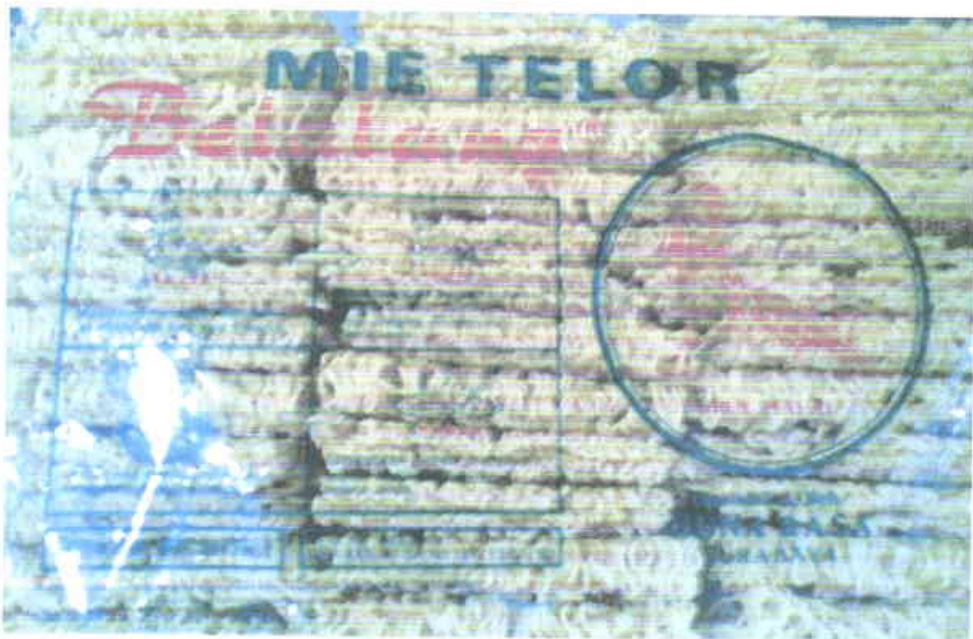
Gambar I. 3. Produk Mie Kering PT. Guna Rasa

Perusahaan mie dan miesoa Guna Rasa bergerak di bidang pembuatan mie dan miesoa kering. Namun perusahaan mie Guna Rasa yang berlokasi di jalan Simomulyo, Surabaya hanya bergerak di bidang pembuatan mie kering dengan kapasitas produksi 2,5 hingga 3 ton/hari. Waktu operasi pabrik tersebut adalah 8 jam per hari. Mie kering yang diproduksi oleh perusahaan mie Guna Rasa adalah mie kering cap “Belalang”. Menurut PT. Guna Rasa, mie kering yang dihasilkan memiliki shelf-life tinggi, dimana dengan penyimpanan pada tempat yang kering dan tidak lembab, mie kering dapat disimpan hingga 1 tahun.