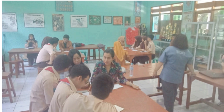
Gambar 5. Workshop Hari Pertama

menggunakan bahasa Inggris. Hal tersebut terjadi karena kurangnya pembiasaan untuk berbicara bahasa Inggris.