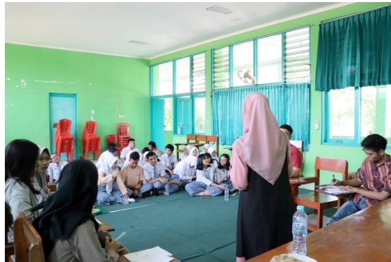
Gambar 4. Simulasi English Debate oleh mahasiswa

Pada akhir acara, pemateri menyampaikan beberapa mosi/ motion yang akan digunakan pada workshop English debate di pertemuan yang akan datang.