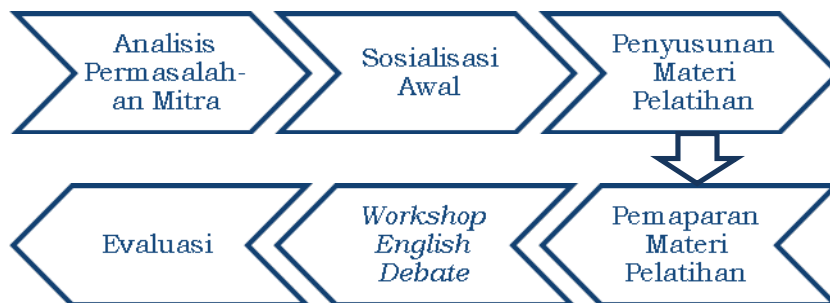
Gambar 1. Tahapan Kegiatan

Program kegiatan pengabdian kepada masyarakat ini dilaksanakan sesuai dengan tahapan-tahapan yang tergambar dalam gambar berikut ini: