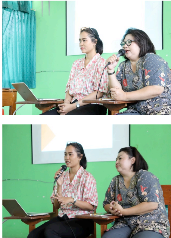
Gambar 3. Pemaparan Materi oleh Tim Pengabdian

terhadap bahasa Inggris dan berpotensi untuk diasah kemampuan berpikir kritisnya. Proses seleksi ini dilakukan agar pelatihan menjadi lebih tepat sasaran mengingat waktu pelaksanaan program yang terbatas.