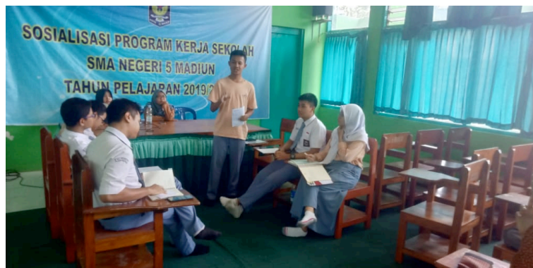
Gambar 6. Workshop Hari Kedua

Pada workshop hari kedua yang berlangsung pada tanggal 7 Oktober 2019, peserta sudah nampak lebih siap untuk berdebat. Secara umum, proses yang dilakukan sama, mulai dari persiapan debat hingga debat selesai. Yang berbeda, kali ini mahasiswa pembantu tim pelaksana tidak lagi mendampingi peserta workshop dalam mempersiapkan materi debat. Para peserta harus mempersiapkan materinya sendiri. Hasil yang didapatkan pada workshop hari kedua adalah peserta yang lebih antusias, lebih berani menyampaikan argument serta pendapat, dan tentunya lebih yakin dalam berbicara menggunakan bahasa Inggris. Peserta tidak lagi malu-malu dan sudah mulai lancar berbicara bahasa Inggris. Dari segi penguasaan skill debat pun mereka sudah lebih baik.