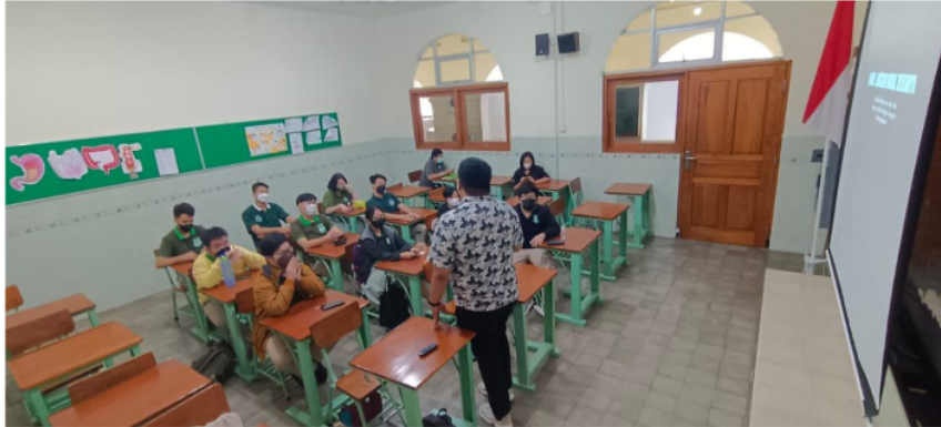
Gambar 3. Suasana workshop kedua

Memproduksi video dalam level professional biasanya dibagi dalam beberapa kategori seperti pra produksi, produksi, dan pasca produksi. Tahapan-tahapan ini membantu pelaksanaan produksi konten gambar dan video jurnalistik sesuai dengan target yang diinginkan atau yang ingin dicapai. Meskipun level penerbitan mikroblogging dan sosial media milik Sanmar belum sampai pada level professional, karena masih dikelola secara amatir oleh siswa-siswi SMA, dibantu dengan guru pembimbing ekstrakurikuler, dan belum berlandaskan pada bisnis dan profit. Pemahaman pengelolaan konten gambar dan video jurnalistik (basis digital) mampu membantu membangun manajemen pengelolaan yang lebih disiplin, hingga bisa menjadi filter pelaksanaan produksi konten yang berkualitas.