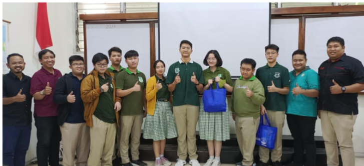
Gambar 3 Suasana Tahap Konsultasi dan Penjurian

Tahap terakhir ini akan dilakukan untuk menilai apakah proses produksi video tersebut benar - benar telah sesuai dengan apa yang telah direncanakan pada saat penulisan naskah, dan juga pengujian apakah efektif untuk dimanfaatkan dan uji coba pada target sasaran pada pembuatan video produksi tersebut.