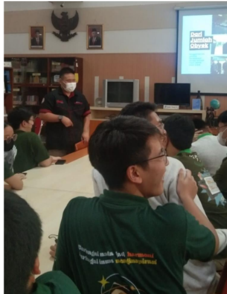
Gambar 2 Suasana Workshop 1

Meskipun standar-standar ini berkembang pada produksi jurnalistik cetak, penerapan produksi karya jurnalistik ini harusnya bersifat luas untuk media yang lain, seperti elektronik dan digital (Sokowati & Junaedi, 2019). Perbedaannya mungkin hanya terletak pada penataan konten, dimana cetak akan lebih berurusan dengan tulisan sedangkan elektronik dan digital mungkin akan lebih mengutamakan image dan moving image sebagai source of information (Hedman & Djerf-Pierre, 2013; Kulkarni et al., 2022; Serazio, 2020).