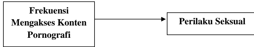
Gambar 1. Hubungan Variabel Penelitian

Remaja adalah masa di mana individu memasuki masa pubertas dan organ-organ serta hormon-hormon seksual mulai berkembang. Berkembangnya organ-organ dan hormon-hormon seksual pada masa ini membuat para remaja mulai mengalami ketertarikan dan menjalin hubungan dengan lawan jenis. Lebih dari itu, perilaku seksual yang muncul pada masa remaja akibat dari berkembangnya organ dan hormon seksual adalah mereka melakukan masturbasi atau onani, kissing , necking , petting , oral seks dan anal seks, hingga perilaku seks yang paling berisiko, yaitu intercourse .