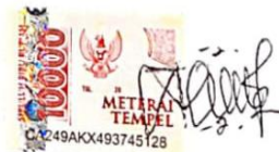
Dominika Konga wandal