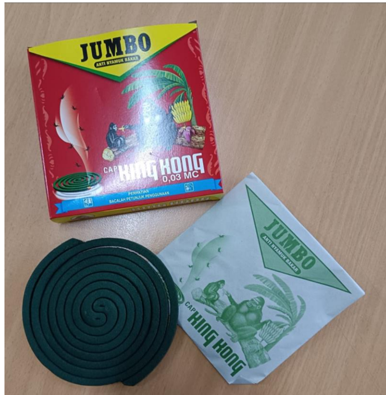
Gambar I.3. Obat Nyamuk Bakar Cap Kingkong Jumbo.