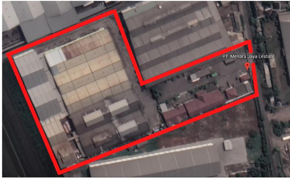
Gambar I.1. Lokasi PT. Menara Jaya Lestari Berdasarkan Google Earth

Tata letak pabrik ( plant layout ) merupakan komponen penting yang perlu diperhatikan agar proses operasi pabrik berjalan secara efisien dan efektif. Tata letak pabrik adalah penataan lokasi berbagai fasilitas yang berada di area pabrik antara lain area produksi, area penyimpanan, utilitas, parkir, dan sebagainya. Plant layout dari PT. Menara Jaya Lestari dapat dilihat pada Gambar I.2.