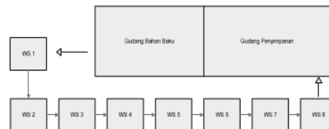
Gambar 3. Layout Lantai Produksi PT. Wahana Lentera Raya

PT Wahana Lentera Raya menerapkan penjadwalan produksi flow shop yang artinya, produksi di workstation tertentu tergantung pada produksi di workstation sebelumnya. Sehingga jika salah satu workstation mengalami bottleneck , maka akan berdampak pada seluruh workstation yang berhubungan.