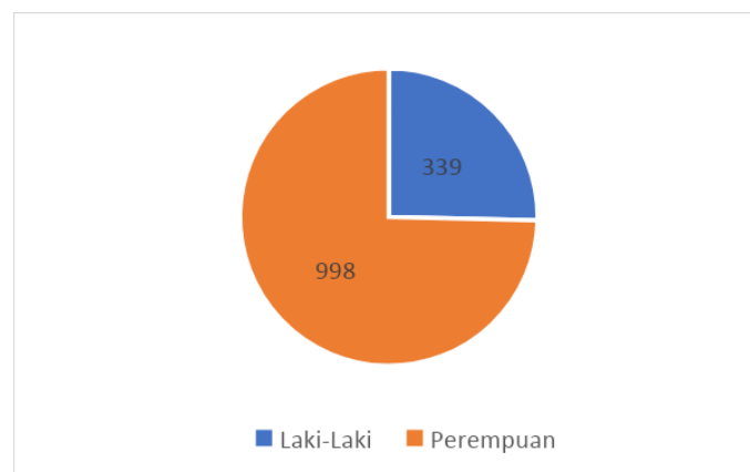
Gambar 2 Frekuensi Responden Berdasarkan Jenis Kelamin (N = 1337)

Dari segi gender, responden perempuan lebih banyak jumlahnya dibandingkan responden laki-laki. Jumlah responden perempuan sebanyak 998 orang sementara responden laki-laki sebanyak 339 orang.