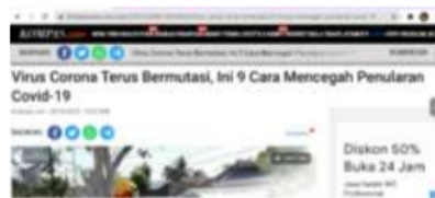
Gambar 4.3 Contoh Pemberitaan Pencegahan Penularan Virus

Berikut contoh pemberitaan mengenai informasi tentang pencegahan Covid yang dimuat oleh Kompas.com