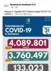
Gambar 4.1 Facebook Kementerian Kesehatan RI