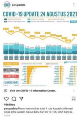
Gambar 4.2 Contoh Unggahan Instagram Mengenai Penyebaran Covid