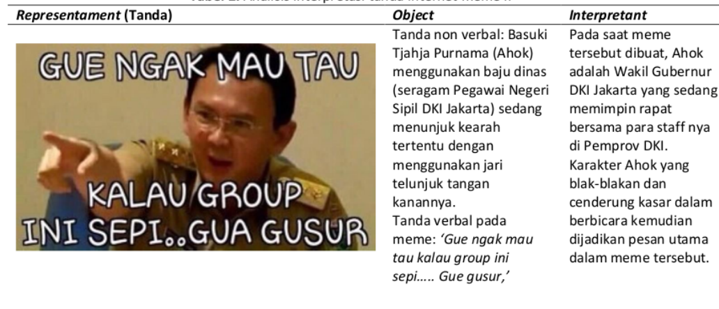
Tabel 2. Analisis interpretasi tanda internet meme II

6 Ahok menjelaskan, dirinya memiliki program "pasukan merah". Menurut Ahok, program ini juga menimbulkan salah persepsi di masyarakat. Banyak pihak menganggap "pasukan merah" untuk menggusur rumah warga. Padahal, lanjut dia, "pasukan merah" untuk merenovasi rumah warga dan mengganti atap dengan baja ringan. Ia meminta para relawan pendukungnya untuk ikut menjelaskan kepada warga. "Tapi, kalau rumah Bapak Ibu ada di bantaran sungai, ya mohon maaf. Kami enggak ada pilihan (menggusur)," kata Ahok. Pada gambar internet meme ke-II membawa konteks makna tentang peristiwa rencana penggusuran yang menjadi bagian dari program Ahok untuk membenahi Jakarta. Tak jarang memang program berbenah Jakarta ala Ahok ini menuai kontroversi di masyarakat umum. Pasalnya karakter dan gaya bertutur Ahok yang memang vulgar dan terus terang dalam berucap dan bertindak. Menelisik kontroversi demi kontroversi, Ahok mengesankan pejabat yang tak suka berdalih, mencari alasan yang dicari-cari, yang hanya membenarkan suatu perbuatan, dan tidak menggambarkan keadaan atau realitas sebenarnya, yang bahkan mengalahkan hal-hal yang bersifat prinsipil (Santosa, 2017: 197). Bagi Ahok, jika melakukan kesalahan, cukup memberi penjelasan, bukan alasan.