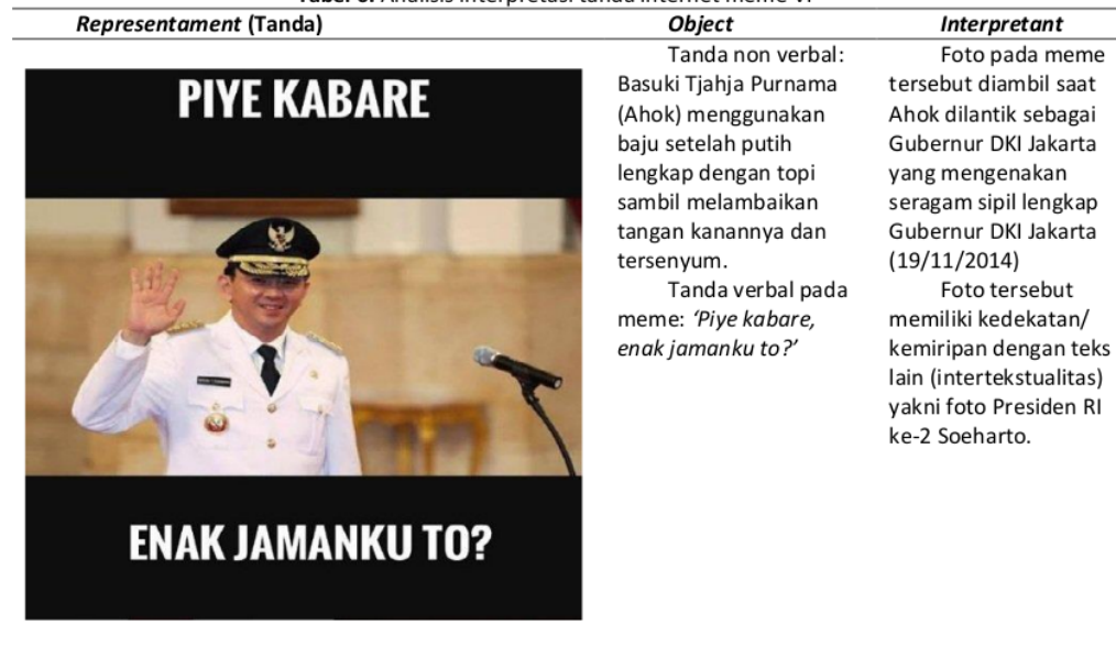
Tabel 6. Analisis interpretasi tanda internet meme VI

Berikut adalah gambar internet meme ke-VI (lihat tabel 6) yang menjadi subyek penelitian terkait penggambaran Ahok sebagai Gubernur DKI Jakarta.