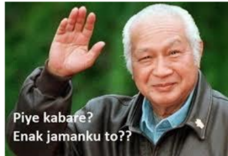
Gambar 1 Intertekstualitas meme Presiden RI ke-2 Soeharto

terus menurun. Hal ini juga serupa dengan apa yang terjadi di DKI Jakarta usai Ahok kalah dalam pilgub DKI Jakarta 2017. Kondisi DKI Jakarta menjadi kacau, contohnya seperti kondisi Pasar Tanah Abang dengan banyak pedagang liar yang mengganggu ketertiban jalan, preman pasar kembali hadir, juga masalah parkir liar.