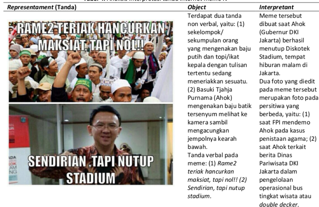
Tabel 4. Analisis interpretasi tanda internet meme IV

Lebih lanjut, stigma dalam konteks kehidupan sosial menunjuk pada ciri negatif yang melekat pada diri seseorang karena dianggap ternoda, memiliki perilaku tercela atau menyimpang (Santosa, 2017). Stigma inilah yang menjadi makna dari internet meme Ahok yang tersebar di berbagai media komunikasi interpersonal sebagai pesan politik bergaya humor ala internet meme. Stigma tentang karakter Ahok sang Gubernur DKI Jakarta yang kasar dan blak-blakkan , bahkan terkesan tak tahu sopan santun inilah yang menjadi konteks latar makna atas tanda pada internet meme Ahok.