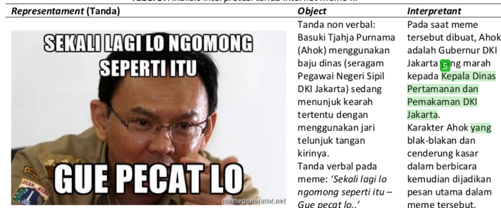
Tabel 3. Analisis interpretasi tanda internet meme III

Internet meme sebagai perantara pesan politik dengan gaya humor menjadi kajian yang dapat lepas dari etika politik dan kekuasaan. Etika politik tidak hanya masalah perilaku politikus. Namun ia juga berhubungan dengan praktik institusi sosial, hukum, politik, nilai-nilai komunitas, dan ekonomi. Ahok sebagai politikus dalam gambar meme yang telah direproduksi oleh pengguna tanda tak terdeteksi ini mengandung aspek individual sekaligus sosial. Karakter individu Ahok yang dibawa dalam meme tersebut membawa tanda atau stigma yang membekas dalam benak audiens pengguna tanda (masyarakat).