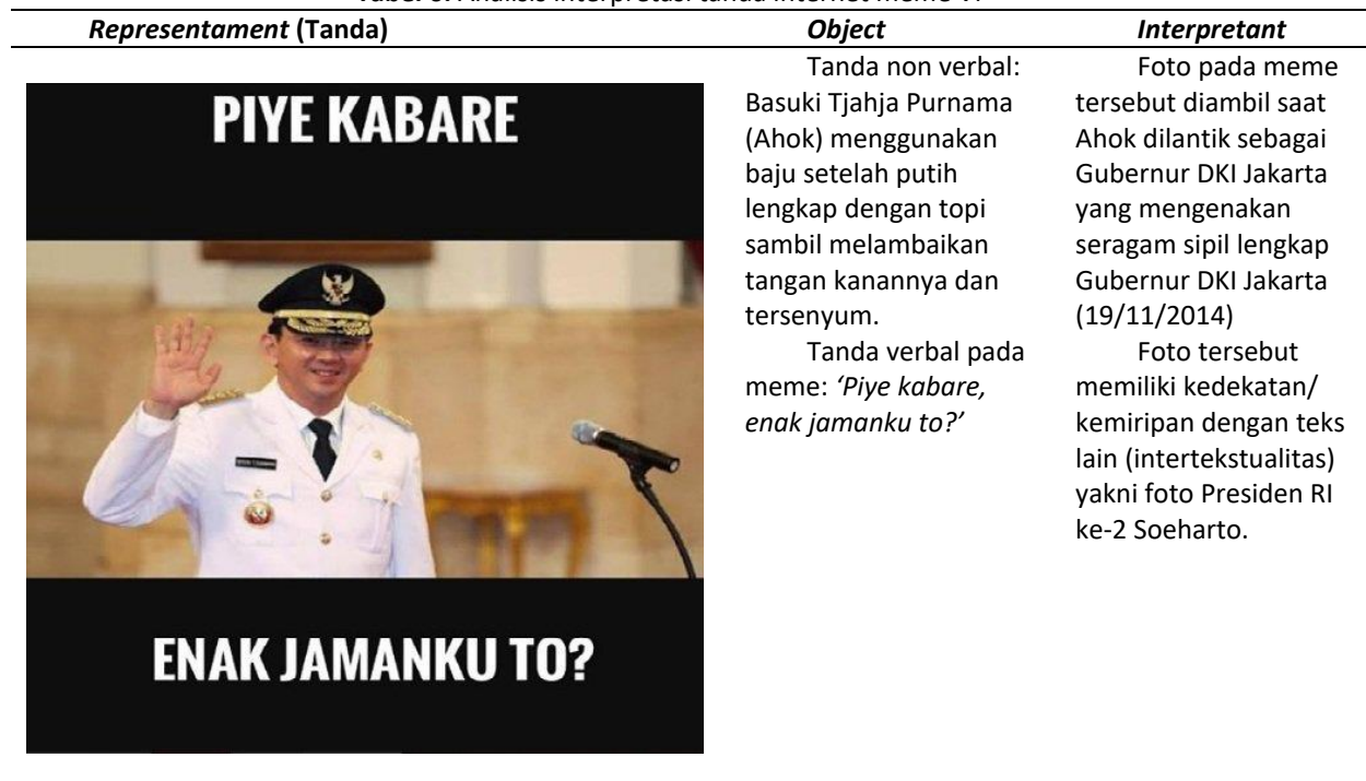
Tabel 6. Analisis interpretasi tanda internet meme VI

Berikut adalah gambar internet meme ke-VI (lihat tabel 6) yang menjadi subyek penelitian terkait penggambaran Ahok sebagai Gubernur DKI Jakarta.