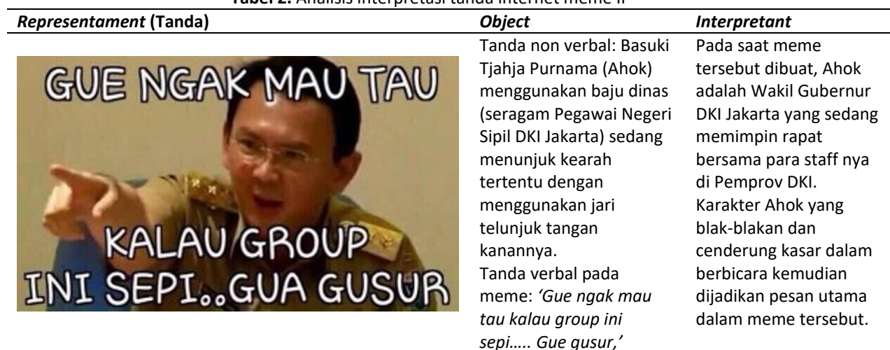
Tabel 2. Analisis interpretasi tanda internet meme II

Ahok menjelaskan, dirinya memiliki program "pasukan merah". Menurut Ahok, program ini juga menimbulkan salah persepsi di masyarakat. Banyak pihak menganggap "pasukan merah" untuk menggusur rumah warga. Padahal, lanjut dia, "pasukan merah" untuk merenovasi rumah warga dan mengganti atap dengan baja ringan. Ia meminta para relawan pendukungnya untuk ikut menjelaskan kepada warga. "Tapi, kalau rumah Bapak Ibu ada di bantaran sungai, ya mohon maaf. Kami enggak ada pilihan (menggusur)," kata Ahok. Pada gambar internet meme ke-II membawa konteks makna tentang peristiwa rencana penggusuran yang menjadi bagian dari program Ahok untuk membenahi Jakarta. Tak jarang memang program berbenah Jakarta ala Ahok ini menuai kontroversi di masyarakat umum. Pasalnya karakter dan gaya bertutur Ahok yang memang vulgar dan terus terang dalam berucap dan bertindak. Menelisik kontroversi demi kontroversi, Ahok mengesankan pejabat yang tak suka berdalih, mencari alasan yang dicari-cari, yang hanya membenarkan suatu perbuatan, dan tidak menggambarkan keadaan atau realitas sebenarnya, yang bahkan mengalahkan hal-hal yang bersifat prinsipil (Santosa, 2017: 197). Bagi Ahok, jika melakukan kesalahan, cukup memberi penjelasan, bukan alasan.