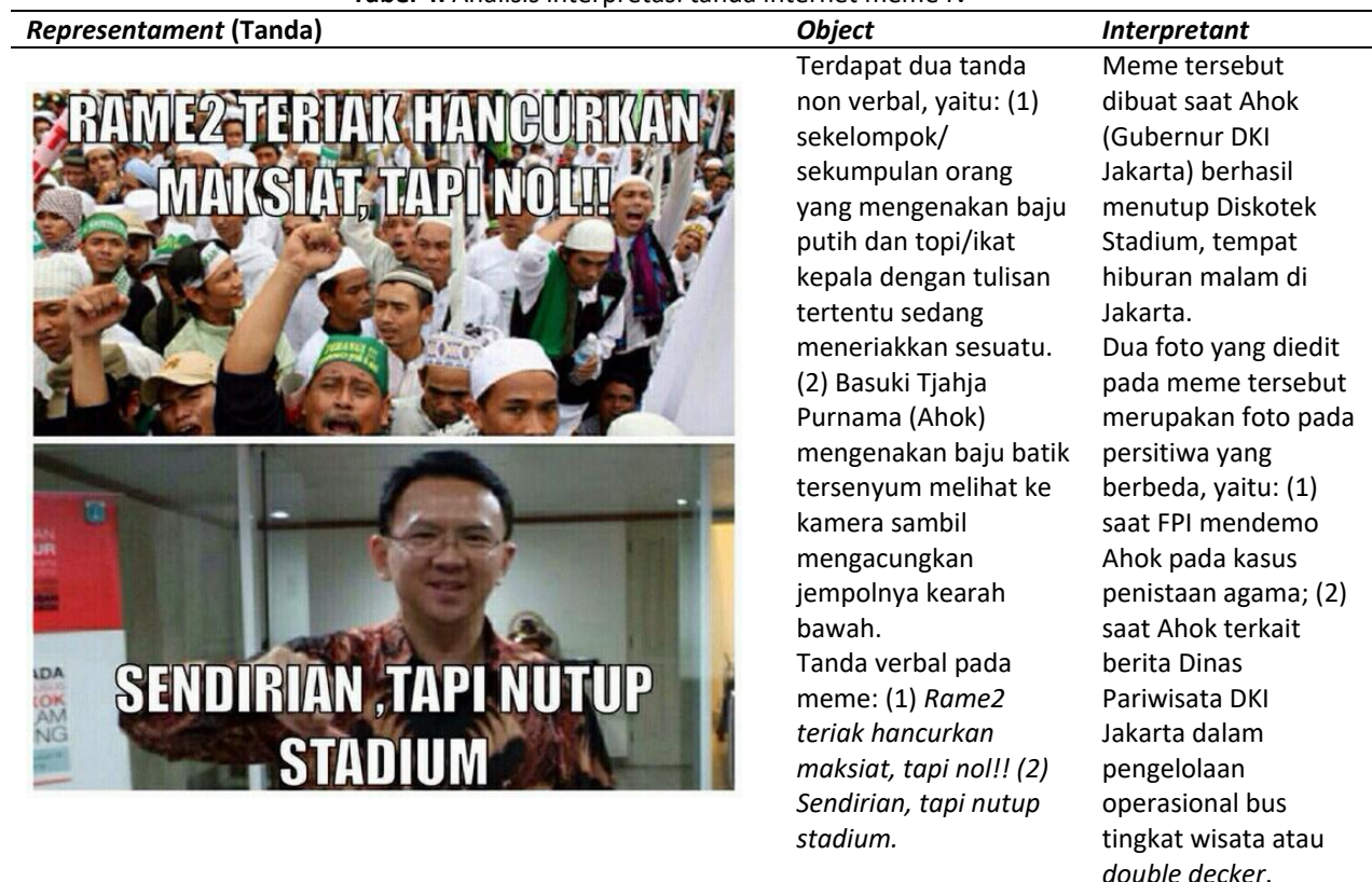
Tabel 4. Analisis interpretasi tanda internet meme IV

Lebih lanjut, stigma dalam konteks kehidupan sosial menunjuk pada ciri negatif yang melekat pada diri seseorang karena dianggap ternoda, memiliki perilaku tercela atau menyimpang (Santosa, 2017). Stigma inilah yang menjadi makna dari internet meme Ahok yang tersebar di berbagai media komunikasi interpersonal sebagai pesan politik bergaya humor ala internet meme. Stigma tentang karakter Ahok sang Gubernur DKI Jakarta yang kasar dan blak-blakkan , bahkan terkesan tak tahu sopan santun inilah yang menjadi konteks latar makna atas tanda pada internet meme Ahok.