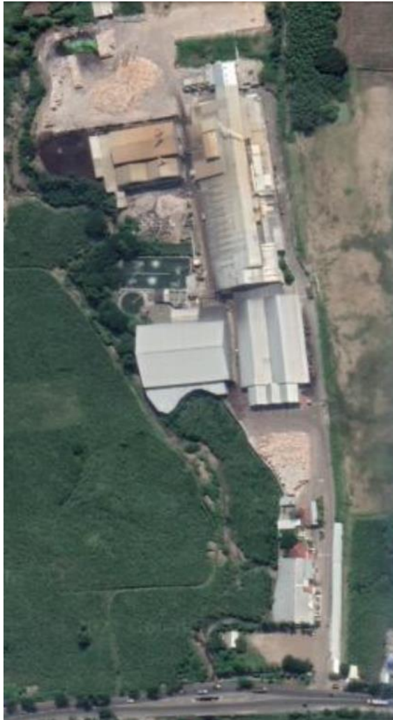
Gambar I.1 Lokasi PT. Sinar Indah Kertas II