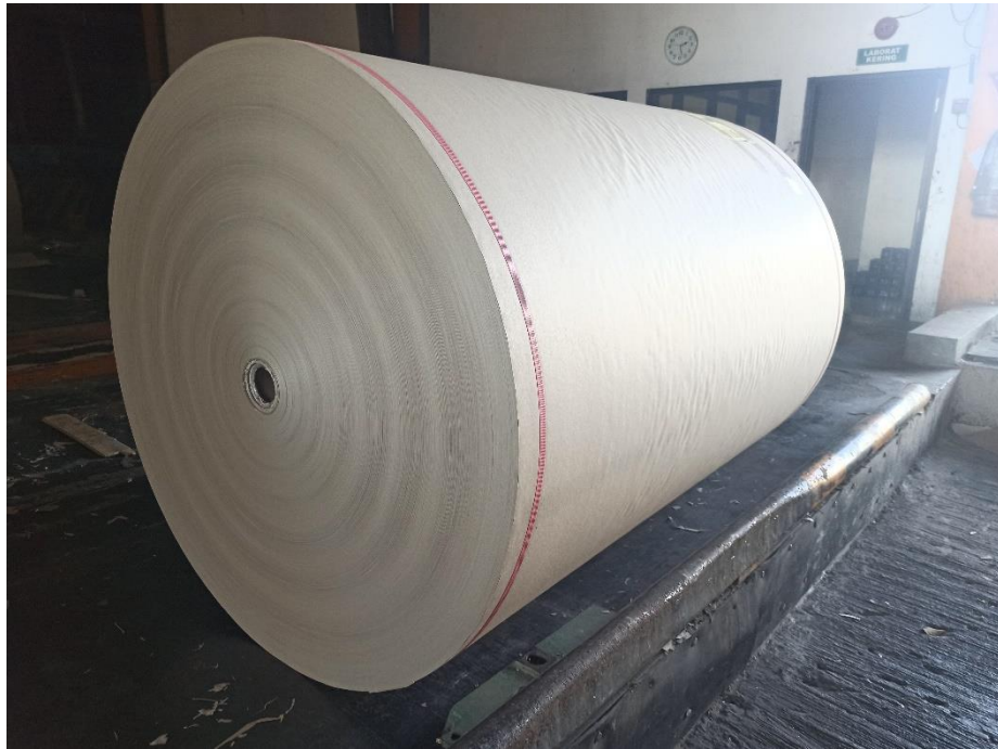
Gambar I.3 Gulungan Kertas Corrugated medium