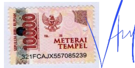
Vincentius Jerremy Saputra

Surabaya, 03 Desember 2021 Yang menyatakan