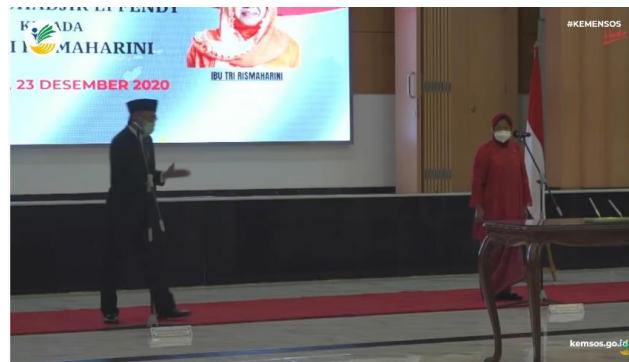
Potongan Video Youtube Kementerian Sosial