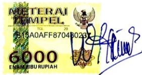
Girdha Warda Palita

Surabaya, 7 November 2019 Yang menyatakan,