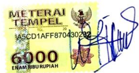
Girdha Warda Palita

Surabaya, 7 November 2019 Yang membuat pernyataan,