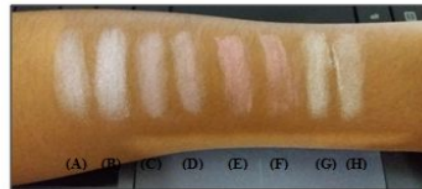
Gambar 3. Hasil pengamatan uji oles sediaan compact powder eyeshadow ekstrak air buah Syzygium cumini (A) Formula I Bets 1; (B) Formula I Bets 2; (C) Formula II Bets 1; (D) Formula II Bets 2 (E) Formula III Bets 1; (F) Formula III Bets 2; (G) Blangko Bets 1; (H) Blangko Bets 2.

Uji iritasi bertujuan untuk memastikan sediaan yang dihasilkan aman dan tidak menimbulkan iritasi bila digunakan. Hasil pengamatan menunjukkan bahwa semua formula tidak menyebabkan iritasi (Tabel 3). Hal ini menunjukkan bahwa perbedaan konsentrasi ekstrak tidak berpengaruh pada hasil uji iritasi. Uji kesukaan bertujuan untuk melihat tingkat kesukaan panelis terhadap produk yang dihasilkan. Hasil pengujian diketahui bahwa semua sediaan disukai tetapi yang paling disukai adalah formula III (Tabel 3).