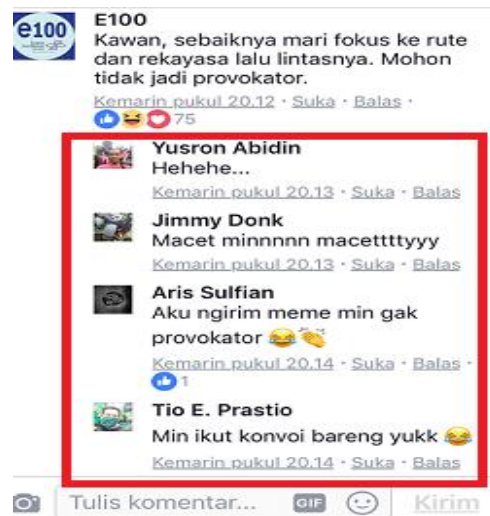
Gambar I.1.3. Contoh postingan komentar berkaitan motif hiburan

Motif hiburan berkaitan dengan followers menggunakan facebook E100 Suara Surabaya demi pemenuhan kebutuhan diri sebagai seorang individu akan pelepasan dari perasaan tegang dan kebutuhan akan hiburan yang mendorong followers untuk memutuskan berkomentar.