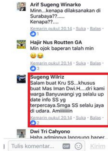
Gambar I.1.5. Contoh postingan komentar berkaitan sebagai motif identitas personal

Motif informasi berkaitan mengenai keinginan berkomentar untuk mengetahui segala bentuk informasi lanjutan mengenai berita yang terdapat dalam postingan facebook E100 Suara Surabaya.