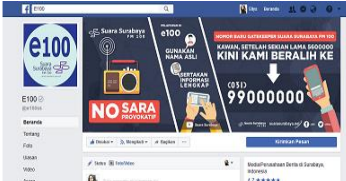
Gambar I.1.1. Tampilan akun Facebook E100 Suara Surabaya