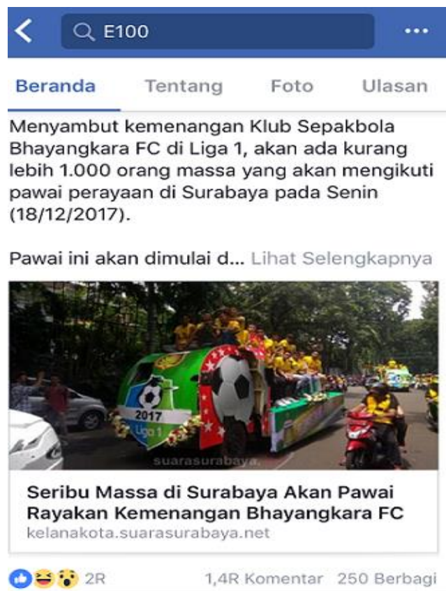
Gambar I.1.2. Postingan akun Facebook E100 Suara di dinding / wall

Jenis aktifitas yang dilakukan followers facebook E100 Suara Surabaya dalam berkomentar, seperti yang telah dijelaskan Sri Widowati tersebut memiliki keterkaitan dengan kebutuhan atau motif yang melatarbelakangi penggunaan media sosial facebook itu sendiri. Dalam penelitian ini, motif yang digunakan followers untuk berkomentar pada postingan E100 Suara Surabaya yaitu (Kriyantono, 2014: 216): (1) Informasi; (2) Motif Identitas Pribadi; (3) Motif Integrasi dan Interaksi Sosial; (4) Motif Hiburan. Beragamnya motif dari penggunaan dan pemanfaatan media sosial sebagai sarana komunikasi oleh individu, kelompok, maupun organisasi atau perusahaan inilah yang menjadi kajian dalam penelitian ini.