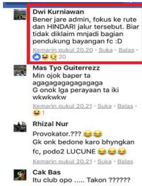
Gambar I.1.6. Contoh postingan komentar berkaitan sebagai motif integrasi dan interaksi sosial

Motif integrasi dan interaksi sosial menjelaskan bahwa followers menggunakan komentar untuk berkomunikasi dengan followers lainnya yang ada di facebook E100 Suara Surabaya untuk memperoleh informasi berlanjut mengenai postingan informasi dan berita yang ada.